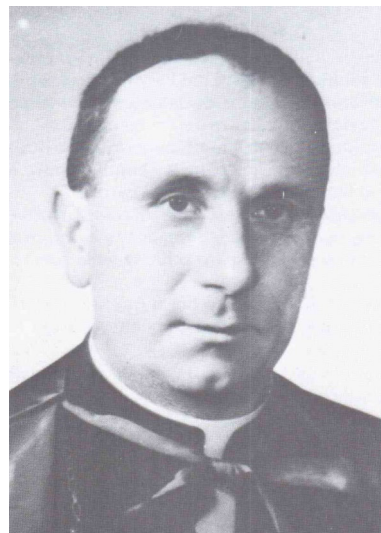
S.E. Mons. Orazio Semeraro

Nel 1968, pertanto, fu stipulata una Convenzione tra S.E. Mons. Orazio Semeraro (1906-1991), Arcivescovo