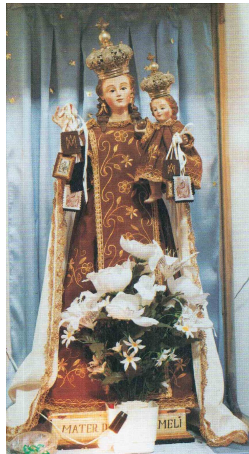
Statua della Madonna del Carmine