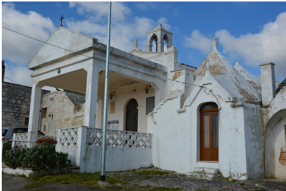
Parrocchia di Santa Maria Vergine del Monte Carmelo