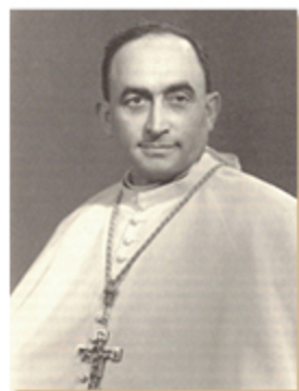
Giovanni Telesforo Cioli

Giovanni Telesforo Cioli , invece, fu un partecipante assiduo al Concilio. Come vescovo, tenne costantemente informata la propria diocesi sull'importanza dell'evento, indisse celebrazioni speciali e invitò clero e fedeli all'impegno nella preghiera e nella vita interiore. Durante il Concilio tenne conferenze, lezioni e produsse scritti, stimolando un ampio rinnovamento conciliare, che consolidò poi attraverso sei convegni annuali e un sinodo diocesano.