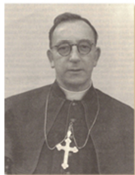
Donal Raymond Lamont

Donal Raymond Lamont , irlandese, si distinse per la chiarezza e la concisione delle sue proposte in fase pre-preparatoria: ordinazione diaconale di laici sposati nelle zone con scarsità di sacerdoti, e abolizione dell'astinenza dalla carne il venerdì, da sostituire con una nuova forma di penitenza.