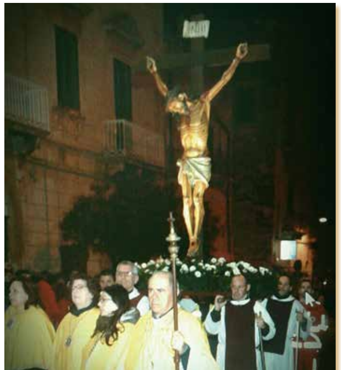
QUARESIMA E NON SOLO