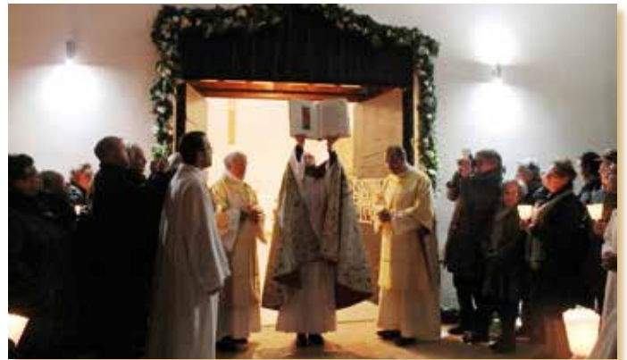
UNA PORTA SANTA NELLA NOSTRA OSTUNI

Bisogna nutrire le radici, per avere grandi ali; fiorire sulla terra, per fare del cielo il proprio giardino.